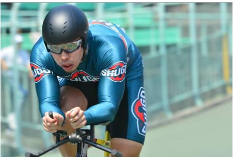
1 kmタイムトライアル