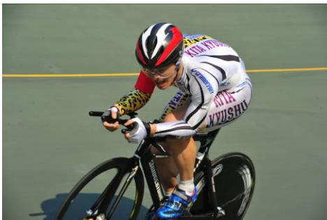
4 km個人パーシュート