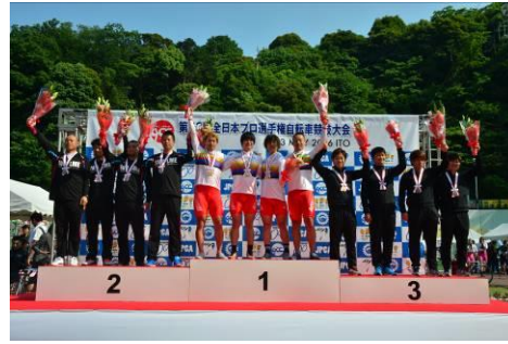
チームパシュート表彰