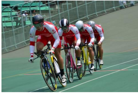
チームパシュート