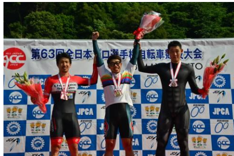
1 kmタイムトライアル表彰