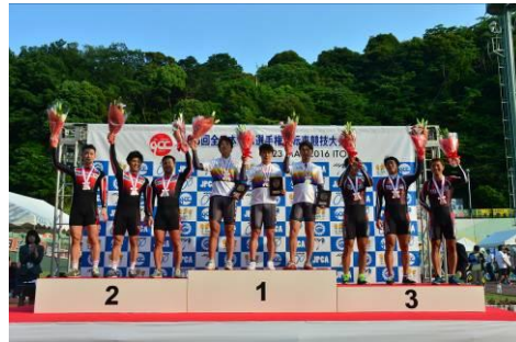
チームスプリント表彰