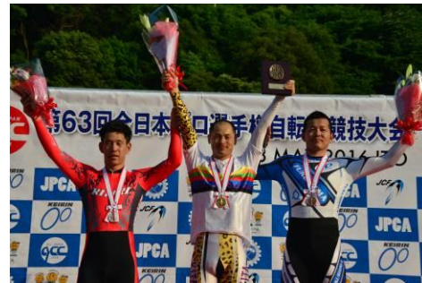
4 km個人パーシュート表彰